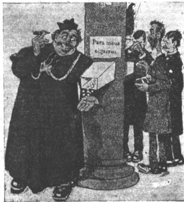
Ahi Como a crença é generosa! Oxalá ella se conserve firme aos ataques dos nossos inimigos.

Na actual sociedade facilmente deixa-se seduzir a mulher. O meio mais effizaz de empregar neste caso é evitar uma educação mystificadora e sophismavel para a "indifesa" mulher. De-se-lhe uma educação modesta, porem que se lhe afastem os catecismos e se lhe prove as iniquidades da burguesia, evitaremos a reprodução prematura da sedução. A mulher instruida, conhecendo os erros em que laboram as donzellas no actual regimen social, entregando-se ao homem que simplesmente tem a apparencia de uma posição elevada, seria o meio mais pratico e invololvel, contra as falsas palavras de um seductor. Seria o fim da prostituição, do rebaixamento mercenario e vil! Este é o meio innocente para combater esses typos, miseraveis traficantes da honra da donzella inexperiente. — J. M. BRASS.